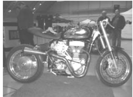
Keski-Suomen MP-näyttelyn yleisön suosikkipyöräksi valittiin paikallisen rakentajan tyylikäs Harley "Lime Eagle"

Tampereen Messu- ja Urheilukeskus Pirkkahallissa 26.-27.04.08 järjestettävä Hot Rod & Rock Show on avoinna lauantaina 10.00-18.00 ja sunnuntaina 11.00-17.00. Esiintymässä mm. Teräsbetoni, Kilpi ja Deathlike Silence. MMAF on luonnollisesti paikalla. Tilaisuus osuu tämän kirjeen kirjoittamisen ja kirjeen postituksen välimaastoon, todennäköisesti saat kirjeen joko juuri ennen Tampereen tapahtumaa, tai heti sen jälkeen.