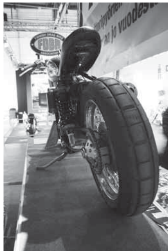
MMAF:n ständillä ollut ahdettu Jawa keräsi yleisöä kuin karpäsiä