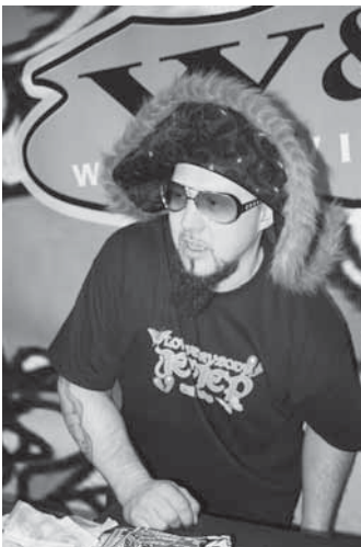
Jep Jepin Kurkolla ei messuhumun meno päätä kylmännnyt