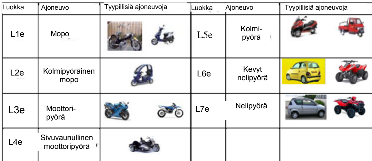
Kuva 1: Esimerkkejä nykyisen puitedirektiivin 2002/24/EY piiriin kuuluvista ajoneuvoista

Termillä 'luokan L ajoneuvot' tarkoitetaan lukuisia kaksi- kolmi- tai nelipyöräisten ajoneuvojen eri tyyppisiä, kuten moottorikäyttöisiä polkupyöriä, kaksi- ja kolmipyöräisiä mopoja, kaksi- ja kolmipyöräisiä moottoripyöriä sekä sivuvaunulla varustettuja moottoripyöriä. Nelipyöräisiä luokan L ajoneuvoja eli nelipyöriä ovat esimerkiksi yleisillä teillä käytettävät maantiemönkijät ja miniautot.